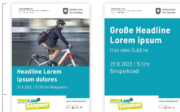
Plakate DIN A2 + A3