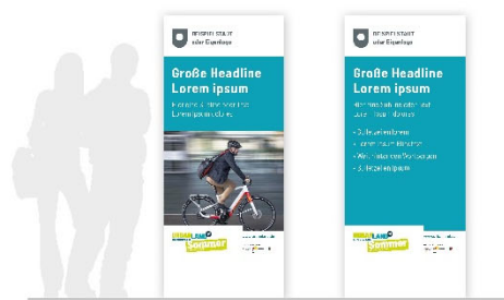
Roll-Up 85 x 200 cm

Die REGIONALE 2022 wird gefördert durch: